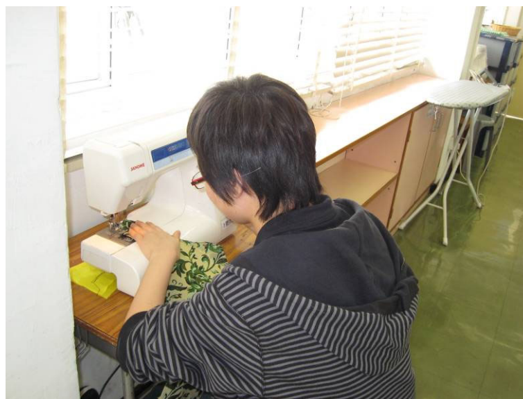
男同學也來車縫和出一分力